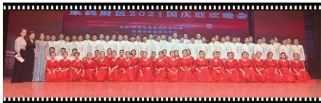
■ 我校学生参加区国庆联欢晚会