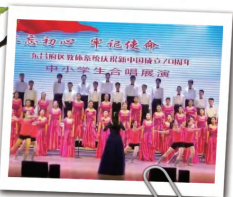
■ 我校学生参加区 中小学生国庆展演