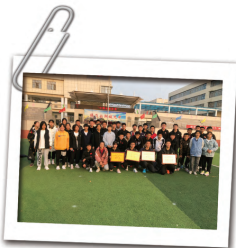
■ 体育生参加区 中小学生运动会