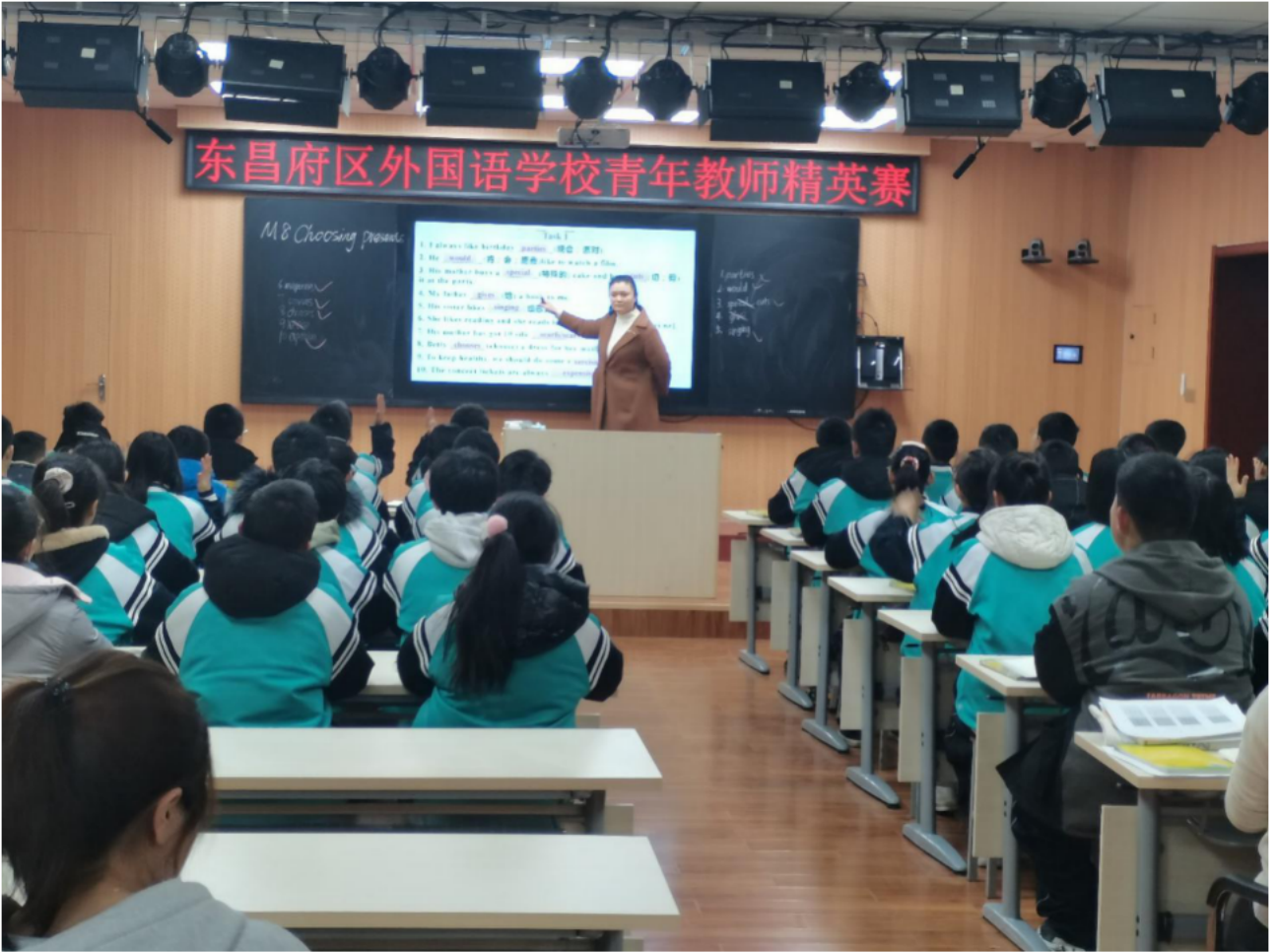
青年教师讲课大赛