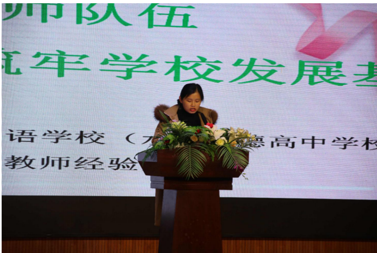
优秀教师经验交流