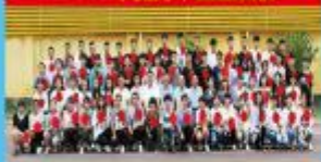
2018年优秀毕业生合影