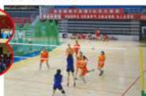
市中小学排球半决赛