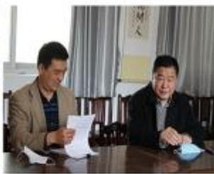
市教育局体育局总督查 杜长涛来我校检查工作