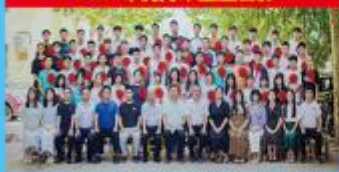
2021年优秀毕业生合影