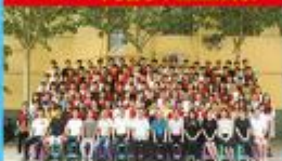
2019年优秀毕业生合影