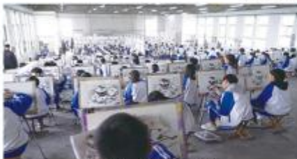
美术生在上专业课