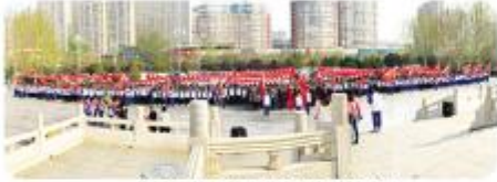
清明节祭英烈研学活动

我校始终坚持德育为先，积极开展各项活动，激发学生潜能，培养良好的校风、学风，促进学生全面发展。