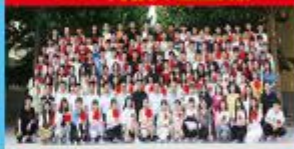
2020年优秀毕业生合影