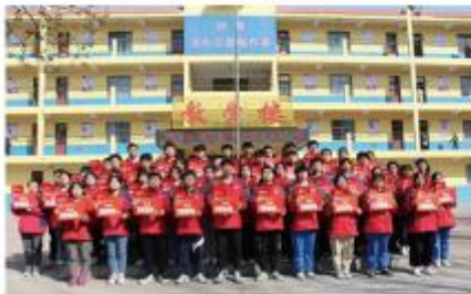
向优秀学生发放奖学金