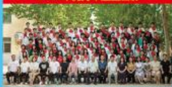
2022年优秀毕业生合影