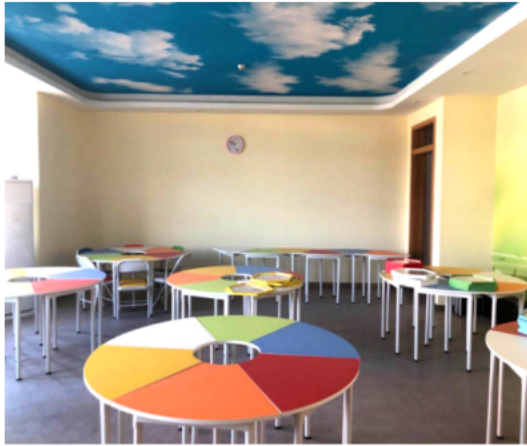
心理健康活动中心