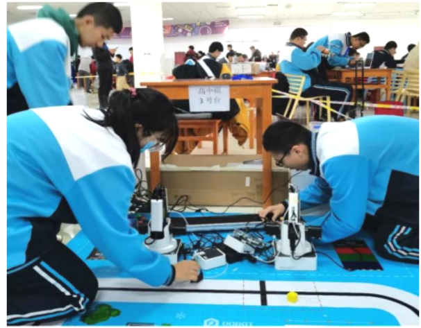
我校学子参加各类科创竞赛