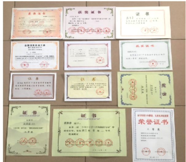
科创竞赛硕果累累

艺体项目，发展特长。实施艺体自助餐式走班教学，艺体教学项目丰富多样，电子钢琴、合唱、彩铅绘画、陶艺、衍纸、书法、篮球、排球、乒乓球、武术、啦啦操等应有尽有，给孩子们充分的自由选择与发展特长的机会，深受学生青睐。