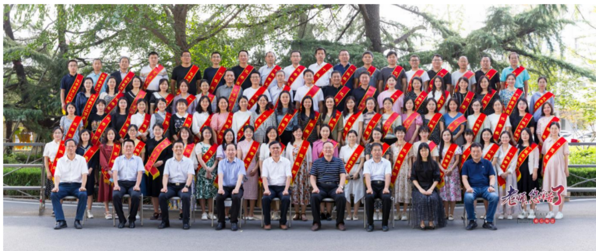
2022 年教师节表彰合影