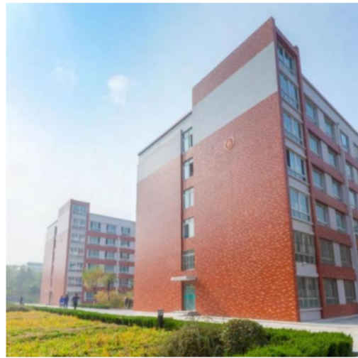
聊城三中开发区校区图书馆